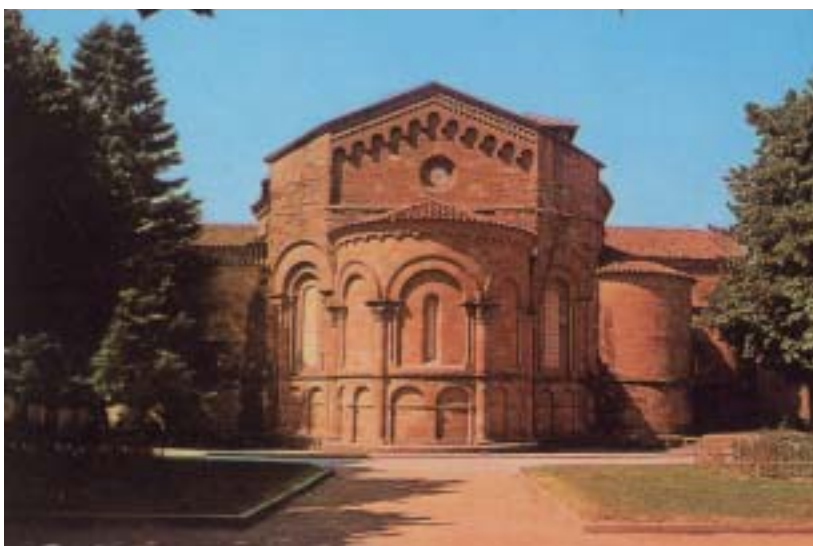
• Absis principal del monestir romànic (Sant Joan de les Abadesses)

Acabada l'Eucaristia ja ens esperen al museu episcopal, l'edifici del qual i els criteris