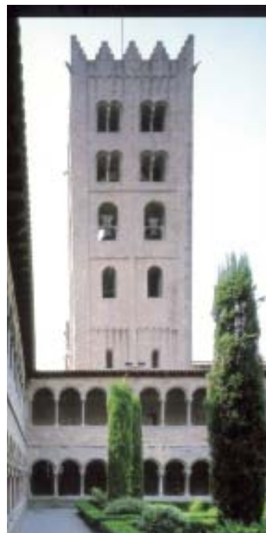
• Monestir Santa Maria de Ripoll

d'exposició són totalment nous de fa ben pocs anys. Dividits en dos grups i acompanyats per una guia cadascun visitem les sales de l'art romànic i les del gòtic. És interessant d'anar contemplant aquelles peces –pintures i retaules sobretot, però també alguns grups escultòrics– que ens transporten als segles XI i XII i que, avançant en el temps, ens condueixen fins als segles XIII-XV. També fem una ràpida visita al dipòsit, atapeït de més obres també catalogades però no exposades en les sales per bé que estan al servei dels estudiosos. Després del museu anem cap a la catedral, on contemplem els enormes frescos de Sert, molt característics tant per la temàtica com per les