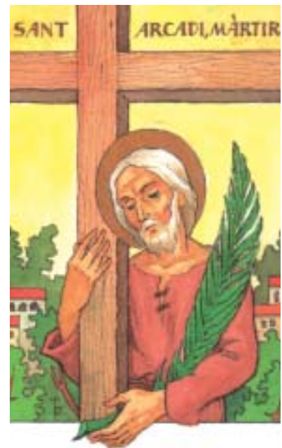
• Dibuix a l'aquarel·la: Oriol M. Diví, monjo de Montserrat

Al cap de poca estona som ja al carrer Aragó de Barcelona; allí mateix on ens havíem trobat fa vuit dies ara ens acomiadem amb bones abraçades i amb un a reveure si a Déu plau. ∞