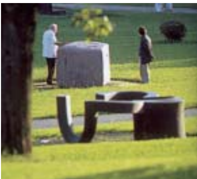
• Museu Chillida Leku

La primera visita que fem, i que serà la més llarga del dia, és al Museu Chillida-Leku, prop d'Hernani. Es tracta de la realització d'un somni llarg temps anhelat per l'autor, fill d'Hernani: crear un gran espai en plena natura on pugui ser exposada