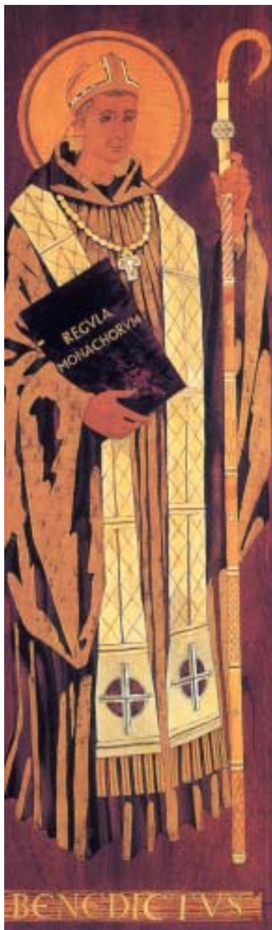
• Dibuix de Josep Obiols.

Permeteu-me, abans d'acabar, de dir encara una paraula sobre l'heretatge a nivell humà del qual és portador el monaquisme avui. Si bé, lamentablement, no sempre hi reeixim al cent per cent, sant Benet ens ensenya a valorar totes les riqueses humanes de les quals és portador cada germà i la comunitat en el seu conjunt. A