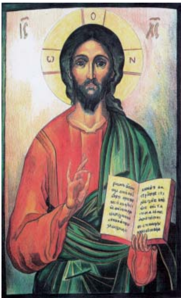
• Sant Martí de Centelles

C reure en Crist significa no només confessar-lo, no tan solament rebre'n alguna cosa, sinó per damunt de tot donar-se a ell. Aquest és el sentit del manament a seguir-lo. I no hi ha altra manera de creure en Crist fora d'acceptar la seva fe com la nostra fe, el seu amor com el