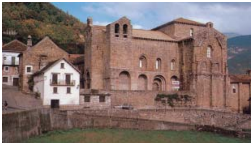
• San Pedro de Siresa

Cap al migdia som ja a Osca, on visitem la catedral, gòtica, començada l'any 1274 per iniciativa de Jaume I el Conqueridor; a l'altar major hi ha un magnífic retaule d'alabastre, de Damià Forment, que ens recorda el de Poblet. La guia ens condueix després, tot passant per diverses placetes i carrers antics, fins a l'església de San Pedro el Viejo,