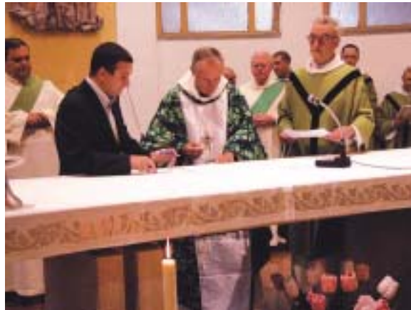
• El jove maltès firma la cèdula d'oblació.