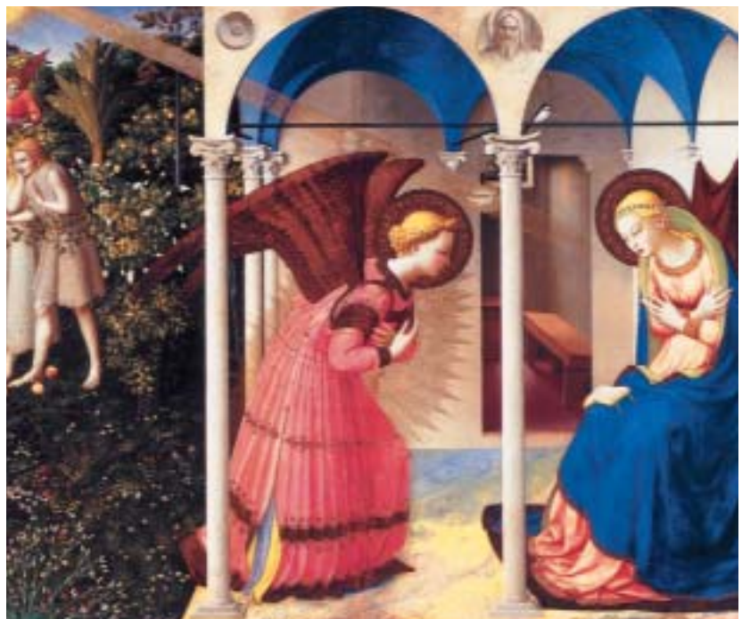
• Fra Angèlic. Anunciació.

Que la Mare de Déu intercedeixi per tots vosaltres, per les vostres famílies i per tots aquells que estimeu. I, ja des d'ara, rebeu en nom propi i en el dels meus germans monjos, el nostre desig sincer d'un bon Nadal. ∞