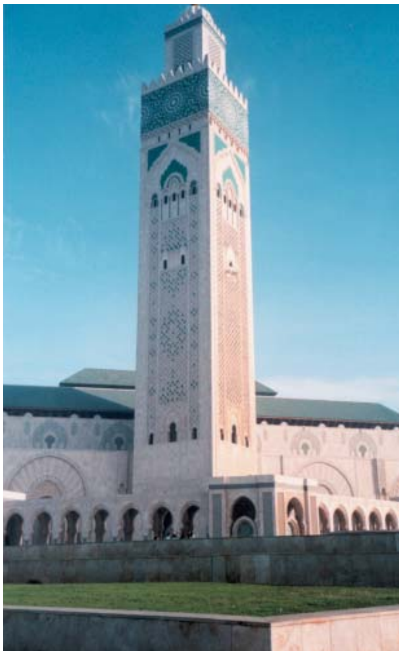
• Mesquita Hassan II. Casablanca

(*) Musulmà, doctor en Religió i Filosofia a Califòrnia, especialitzat en Sufisme i tradicions espirituals de l'Orient; és també Mestre en Psicologia clínica, i com a tal ha ensenyat cinc anys a la universitat d'Islamabad. Fa dotze anys que treballa al Paquistà, d'on és fill, molt compromès en accions d'ajut humanitari i en activitats socials contra la violència i la intolerància.