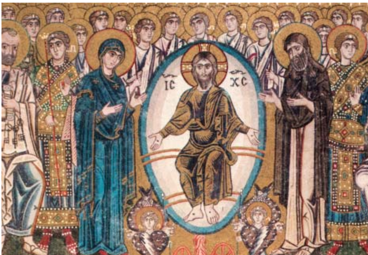
• Judici universal (detall d'un mosaic a Torcello, S. XII - XIII)

Demà celebrarem, doncs, les persones santes, les qui, per ser