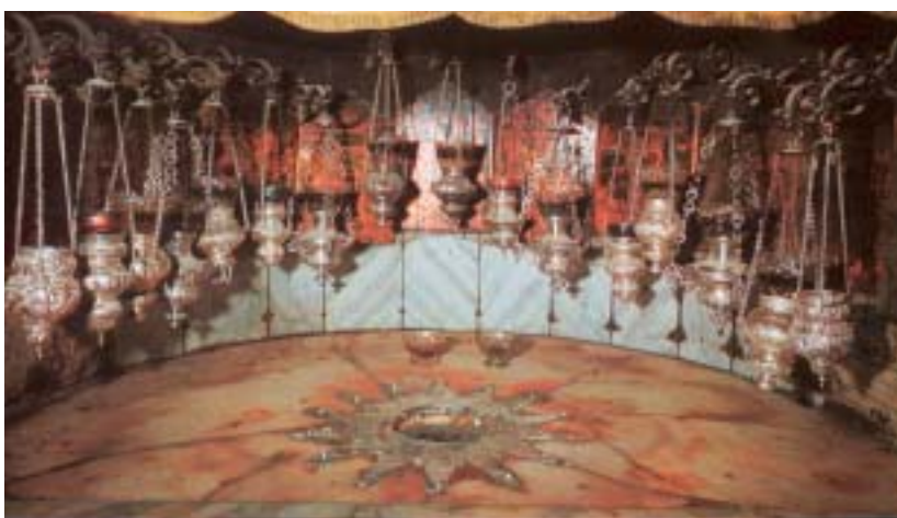
• Betlem, lloc del naixement de Jesús.

N adal és un misteri, i és a la vegada un fet històric que marca una bella fita de progrés, de plenitud, de joia i de pau. Déu, per un acte inefable d'amor etern, ve al món, i aquell qui és Déu immutable, incompreensible i incommensurable es fa petit, assequible, reduït dins el si d'una Verge, primer; i, encara més, després, es fa carn, mengívol, per incorporar-se realment als qui el volen, que l'esperen i als qui reconeixen que ell és el Salvador del món, el Pa baixat del cel, que ve a donar esperança i joia de salvació.