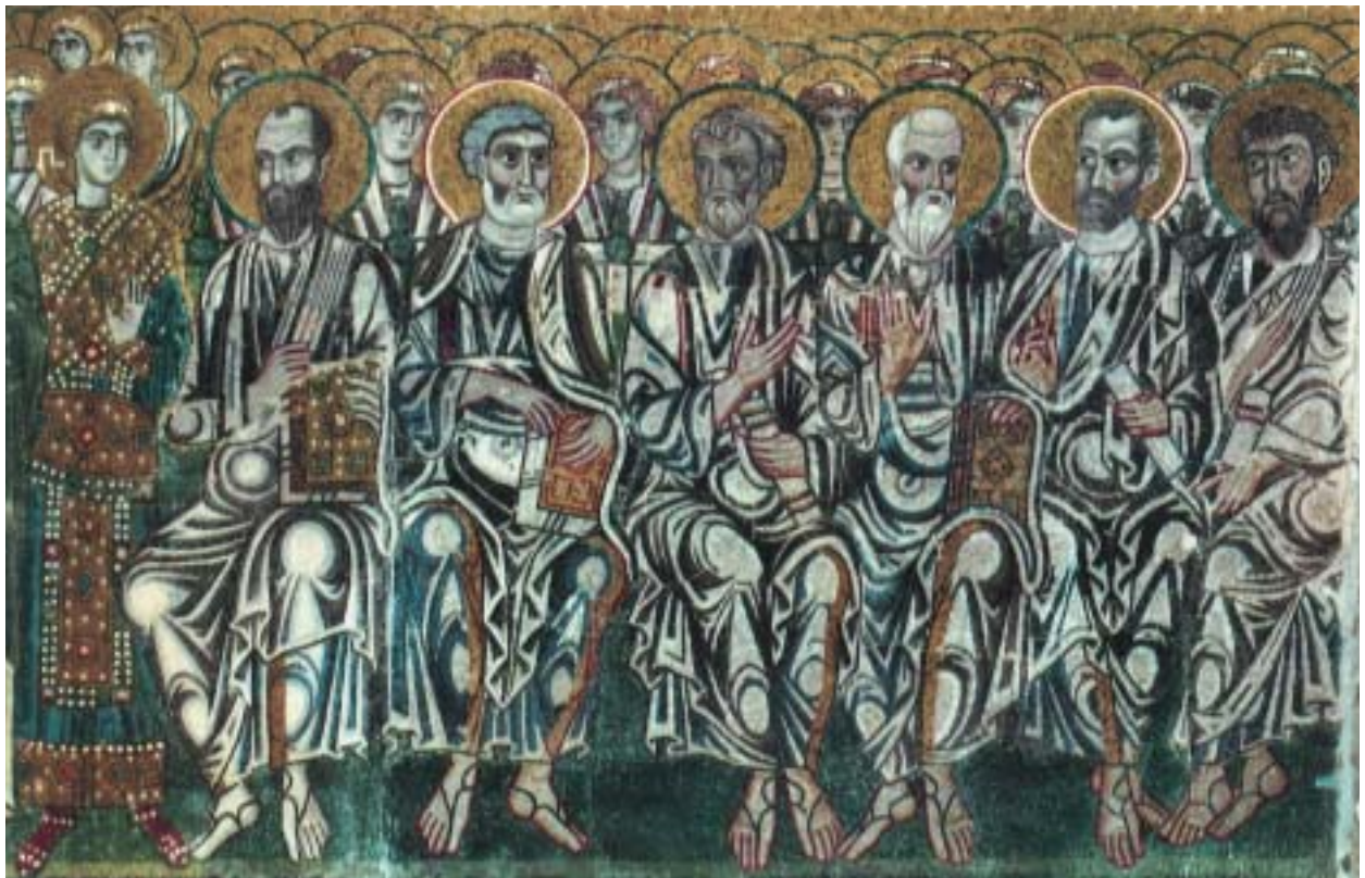
• Judici universal (detall d'un mosaic a Torcello, S. XII - XIII)

aquells milions de persones que en el curs de la història, i de la prehistòria, no han conegut la Revelació, i aquells que tampoc no la coneixen avui, queden exclosos del consorci dels sants? Hem de creure que la comunió dels sants comprèn tots els qui han viscut amb un comportament essencialment recte, fins i tot els qui amb una intenció bona, encara que errònia, no han admès la Revelació. Jesucrist se'ls haurà revelat d'una manera o d'una altra. Aquí s'escau recordar les paraules de sant Pau: Que en són d'incomprensibles els judicis de Déu i d'impenetrables els seus camins (Rm 11,33). Els camins vers la santedat són molts, però tots convergeixen en un de sol. Jesucrist va dir: Jo sóc el camí (Jn 14,6). ∞