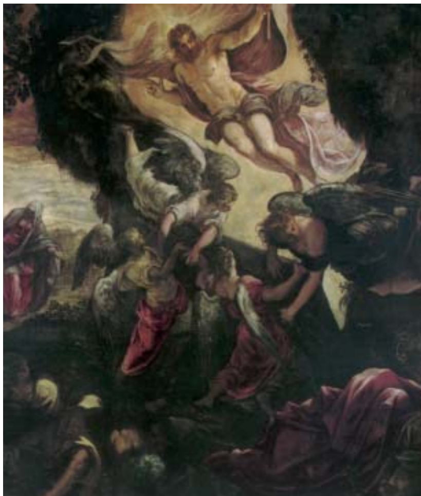
• La resurrecció. Tintoretto