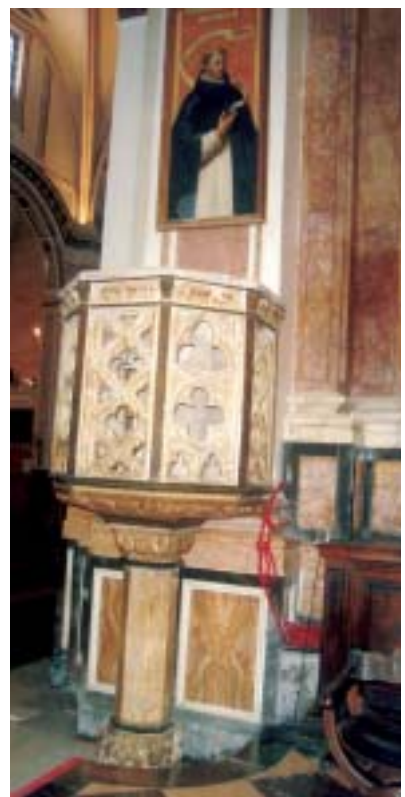
• Catedral. Trona des d'on va predicar Sant Vicent Ferrer.

Com que no ens queda massa temps, en part a causa del retard amb què hem arribat a València, fem una ràpi-