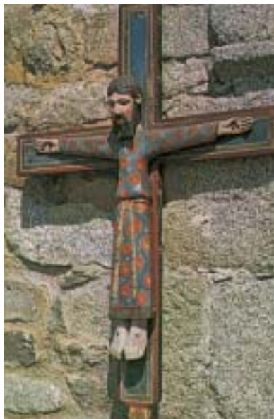
• Crist romànic (s. XII) .

Davant d'aquesta situació aparentment sense sortida, Déu no troba altra alternativa que la d'implicar-se ell mateix en el drama de la salvació. De fet, és el que ha anat fent sempre amb el seu poble, ja des d'Abraham. I com ho ha fet? Amb la promesa d'un fill. Ara, però, han arribat els temps finals, l'hora del Fill (amb majúscules). I és que Déu no pot implicar-se en la salvació del seu poble més que de manera