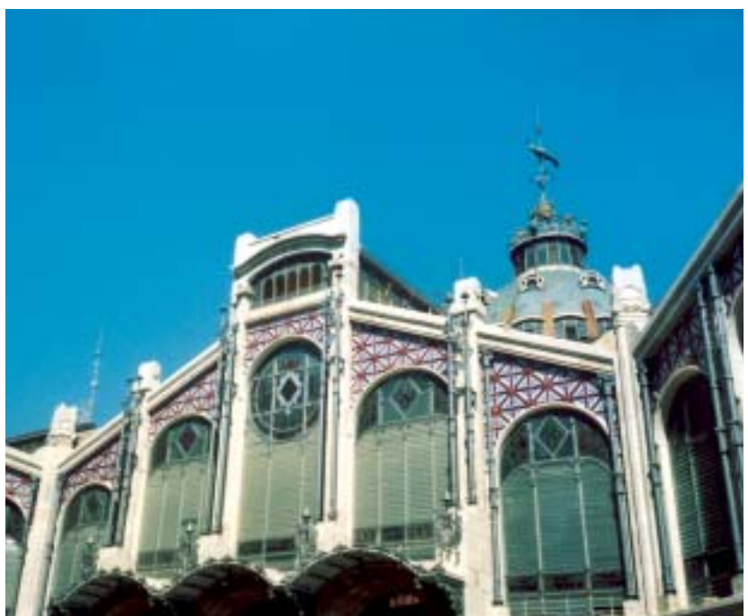
• Mercat central.

El nostre recorregut comença per una gran avinguda que ens condueix fins als carrers antics de València i que, després de passar per davant l'Ajuntament, ens porta al Mercat municipal central, edifici notable, el qual té una façana també modernista; fem un tomb per