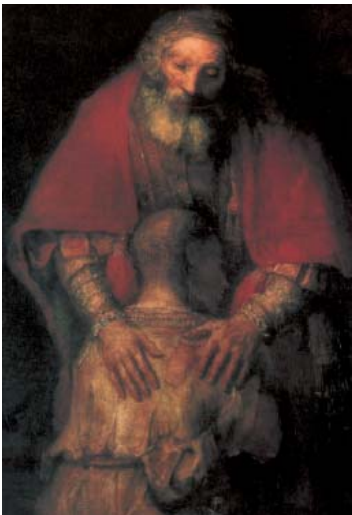
• El retorn del fill pròdig . Rembrandt

quals, de tant en tant, hi ha algunes perles. Com els que busquen or entre la sorra d'un riu i, de tant en tant, després de llençar molta sorra, troben un bocí d'or. Em refereixo al codi penitencial, que també conté algunes perles. Com és aquest Déu? Doncs és un Déu per l'estil del que sant Benet descriu en els capítols 27 i 28. Allà ho diu de l'abat, però ho diu de l'abat en tant que l'abat fa les vegades del Crist. I el Crist és la imatge del Déu invisible. Per tant, com és aquest Déu? És un Déu que comprèn les nostres fallades, que es carrega les nostres fragilitats, que vol que ens esmenem dels nostres pecats. Aquests capítols 27 i 28 són bonics, i si un n'estudia el voca-