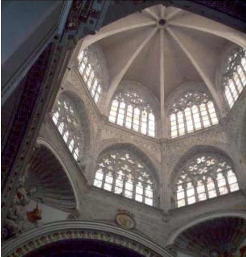
• Cimbori de la catedral.

la visita. La catedral té forma de creu llatina amb tres naus i girola o deambulatori. El 1940 el cor, que era al centre de la nau principal, es va traslladar al presbiteri i, més tard, l'altar major fou col·locat al centre del creuer. El retaule major és com un gran estoig fet per al retaule de plata del segle XV i que conté la imatge de la Mare de Déu de Portaceli. Les portes del retaule van ser pintades per les dues cares a l'oli sobre taula. Té dotze escenes que es refereixen a la vida de la Verge Maria des de la trobada dels seus pares, Joaquim i Anna a la porta daurada de Jerusalem, fins a la seva dormició i assumpció al cel. Des del creuer alcem la mirada per a contemplar i comentar una