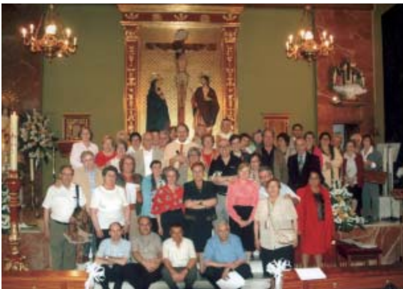
• Alzira, parròquia dels Sants Patrons.