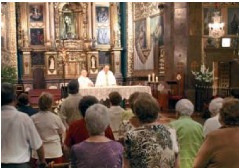
• Eucaristia al Santuari de Nostra Senyora de Lluç.