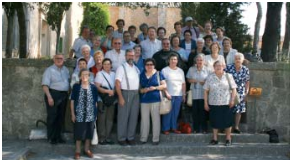
• Tot el grup, amb alguns dels franciscans, al Santuari de Cura.

Ja a l'aeroport, tots tenim les nostres maletes i les ensaimades que hem comprat, els nostres bitllets... i esperem una bona estona el nostre vol. Un petit contratemps, pèrdua d'un carnet d'identitat, però que gràcies a Déu s'ha pogut solucionar aviat, i... ja som a Barcelona. Tot esperant i recollint les maletes ens anem acomiadant de tots amb el desig de retrobar-nos almenys a la pròxima sortida de l'any vinent. Donem gràcies a Déu pel viatge, que podem dir que ha sortit "brodat" en tots sentits; i fins a reveure'ns. ✨