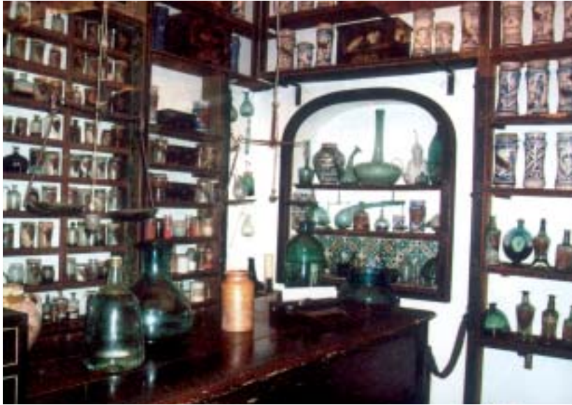
• Valldemossa, antiga farmàcia.

Passeig marítim, curull de banyistes. Hi ha, en efecte, molta animació. Dinem en un bonic restaurant, ran mateix del mar, a base d'un plat típic de l'illa.