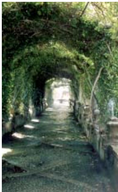
• Jardins d'Alfàbia.

Una petita descripció ens permet conèixer un xic el que anem a visitar. Les cases i els jardins que conformen la possessió d'Alfàbia se situen al terme de Bunyola en una vall al sud-est de la serra d'Alfàbia sota el coll de Sóller. La visita a la finca, propietat de la família Zaforteza, permet conèixer diferents habita-