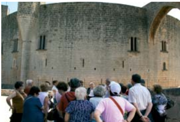
• Castell de Bellver.

interromput per tres torres semicirculars unides al cos principal a més de la de l'homenatge, exempta, que s'hi comunica a través d'un pont. El pati d'armes, molt ampli, és voltat d'una doble galeria d'arcs, de mig punt la baixa i d'apuntalats l'alta. Tot al voltant de la galeria hi ha les dependències. Sobresurt la capella amb reixes i ceràmica