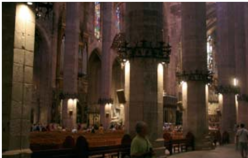
• Catedral de Palma.

Davant de la Seu visitem el castell de l'Almudaina, antic palau dels reis de Mallorca. Com