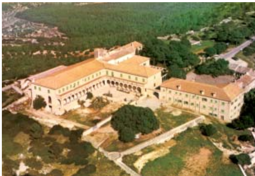
• Visió aèria del Santuari de Nostra Senyora de Cura.