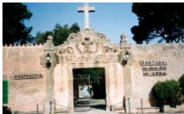
• Entrada al recinte del Santuari.

Ja a Palma el guia, que se'ns ha incorporat al passeig marítim, ens va assenyalant els llocs més importants. No podem entrar a la Llotja, com havíem previst, perquè està tancada a causa d'unes obres que hi fan; ens dirigim, doncs, cap al castell de Bellver, situat a l'est de la ciutat, a uns dos quilòmetres, sobre un turó cobert de boscos de pins, damunt mateix de la costa. Fou construït per l'arquitecte Ponç Descoll per ordre del rei Jaume II de Mallorca, com a residència reial i com a fortalesa alhora. Les obres començaren vers l'any 1300. La construcció, amb carreus, és d'estil gòtic de vastes proporcions i de planta circular. Assentat sobre dos murs concèntrics el perímetre és