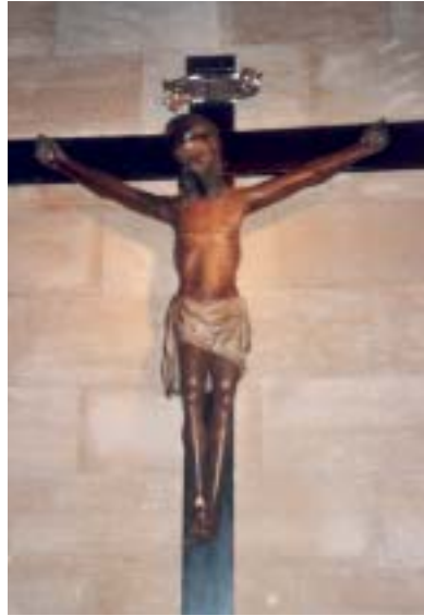
• Sant Crist d'Alcúdia.

Anem cap a Sineu, que no és gaire lluny. Sineu, al centre mateix de l'illa, té un mercat molt important, els dimecres, que aplega molta gent. Ens dirigim cap a la parròquia de la Mare de Déu dels Àngels. El rector no hi és però ja ha deixat la persona que ens atindrà. L'església és