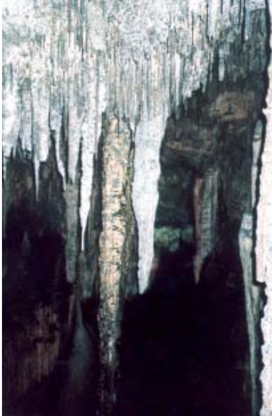
• Coves d'Artà.

Francesc d'Assís. Tota l'atenció se centra en el conjunt escultòrico-arquitectònic que acull l'altar major. La joia més important que acull la Basílica és el sepulcre de Ramon Llull, glòria mallorquina, catalana i universal. Frare, cavaller, filòsof, poeta, alquimista, astròleg, viatger, missioner, és una de les figures cabdals de les lletres catalanes. El sepulcre fou construït el segle XI i podem admirar el meravellós sarcòfag d'alabastre que guarda les despulles del "Beat Ramon".