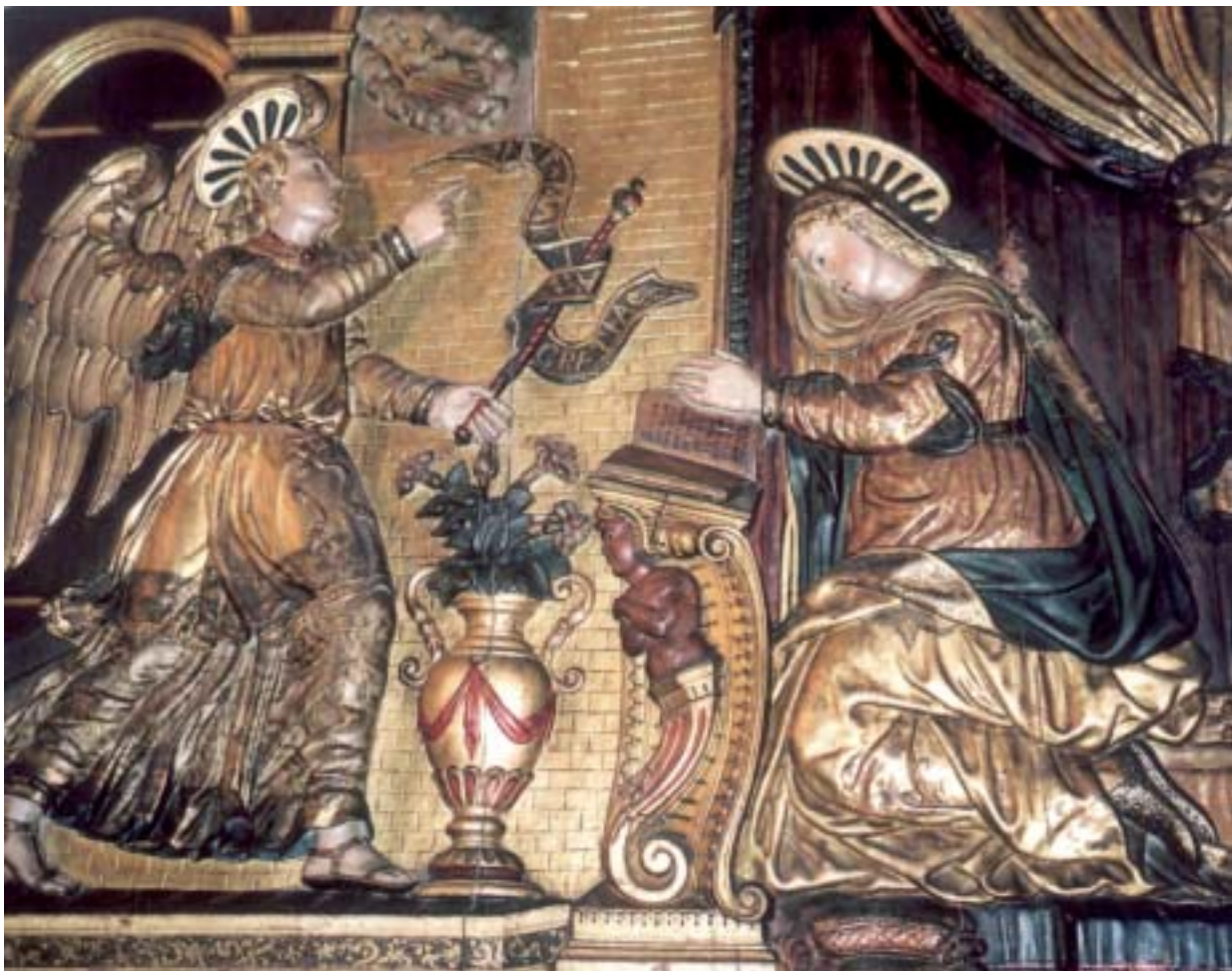
• Anunciació. Parròquia de Sineu.

D éu te guard, plena de gràcia, el Senyor és amb tu. Arribats a l'últim diumenge d'Advent, germanes i germans, sentim amb un fimbreg de joia i d'astorament la salutació de l'àngel Gabriel a Maria. Són les paraules del missatger de Déu, adreçades personalment a la noia de Natzaret, però que valen també per tota l'Església, per cada