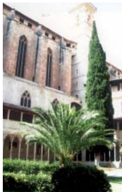
• Basílica de Sant Francesc.

claustre per la porteria ens trobem de cara amb set arcs de disseny senzillíssim formats per un basament i uns capitells molt simples i unes columnes llises de vuit cares. Al fons veiem l'ala potser més bella del claustre; a dreta i a esquerra hi ha dues galeries de disseny posterior més florit. Mereix atenció el brocal i el magnífic ferro forjat de la cisterna situada al centre del jardí monacal, com també el característic campanar, enlairat, que presideix el conjunt. Al fons trobem la porta d'accés a la Basílica, dedicada a recordar la impressió de les cinc llagues de Jesucrist a Sant