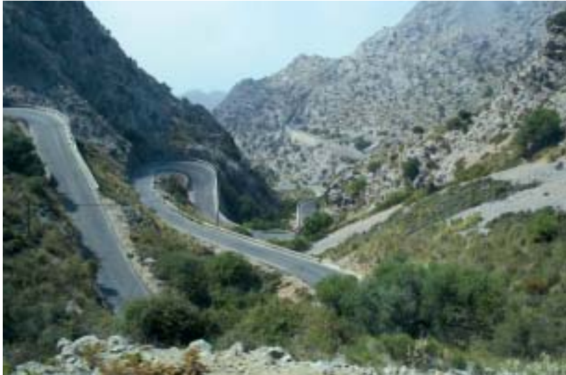
• Carretera cap a Sa Calobra.

derat el símbol religiós i cívico-cultural del poble mallorquí, i hi ha contribuït l'Escolania dels "Blauets", que cada dia canta a la Mare de Déu en nom de tot Mallorca. Arribà a l'apogeu el 1884 quan el bisbe Mateu Jaume i en nom de Lleó XIII coronà la imatge, i la Mare de Déu de Lluc fou proclamada reina i patrona de Mallorca. La imatge, dreta, amb el nen als braços, és obra dels segles XIV-XV. Té una alçada de 61 cm i és de pedra fina; des de sempre té el color negre.