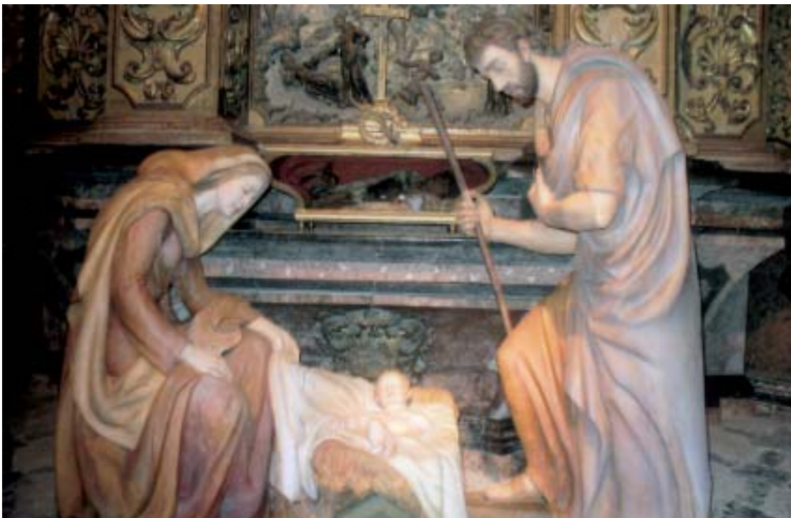
• Detall d'un pessebre a la catedral de Palma de Mallorca.

De sempre, des de la incompreensible eternitat, Déu no és aïllament sinó comunió, no és un Jo solitari sinó Trinitat d'Amor. I perquè és Amor crea, crida a l'existència (cf. Jb 34,14-15; Sav 11,25; Jn 1,3), i, més encara, vol establir llaços de comunió amb tot el que ha creat. I molt singularment amb l'home i la dona, fets a la seva imatge (cf. Gn 1,27). Per això, per més que repetidament la criatura s'oblidi del qui l'ha creat, més tossudament encara Déu, el Creador, cerca i crida la humanitat, el poble, l'obra de les seves mans: On ets?