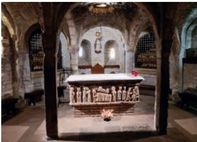
Catedral de Roda d'Isàvena. Interior i Cripta.

medieval que una riuada es va endur el 1963. Només podem veure els edificis per fora, perquè no ens podem esperar fins a l'hora que els obren, però el paratge és un prat molt bonic i hi passem una bona estona. Les dues construccions més destacables, totes dues romàniques, són l'església de Santa Maria, molt gran, amb tres absis, i, a uns 50 metres, l'ermita de Sant Pau, que probablement era el lloc on s'allotjaven els pelegrins. Al costat de Santa Maria veiem les ruïnes del que havia estat el gran palau prioral i, tocant al riu, l'antic molí, avui reconvertit en alberg juvenil o casa de colònies, on trasteja un grup de nois i noies d'una parròquia de Barbastre.