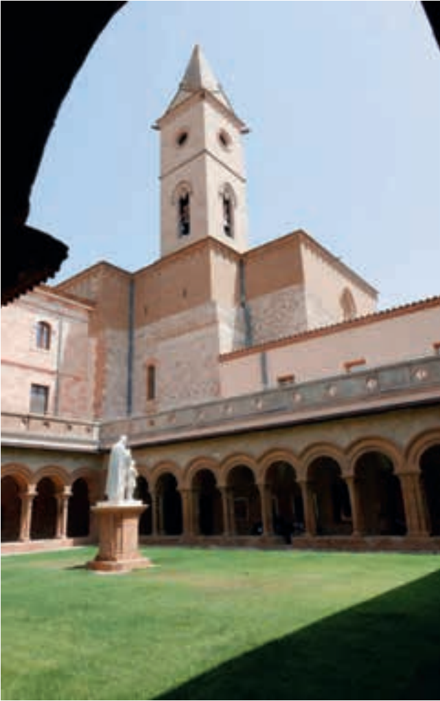
Monestir de Santa Maria de Bellpuig de les Avellanès.

més amunt, és a tocar de la plaça de l'Església, on també hi ha l'ajuntament. Només cal travessar el riu Nere, que dona nom a l'hotel i que desemboca a la Garona uns 200 metres més avall. Sopar i a descansar.