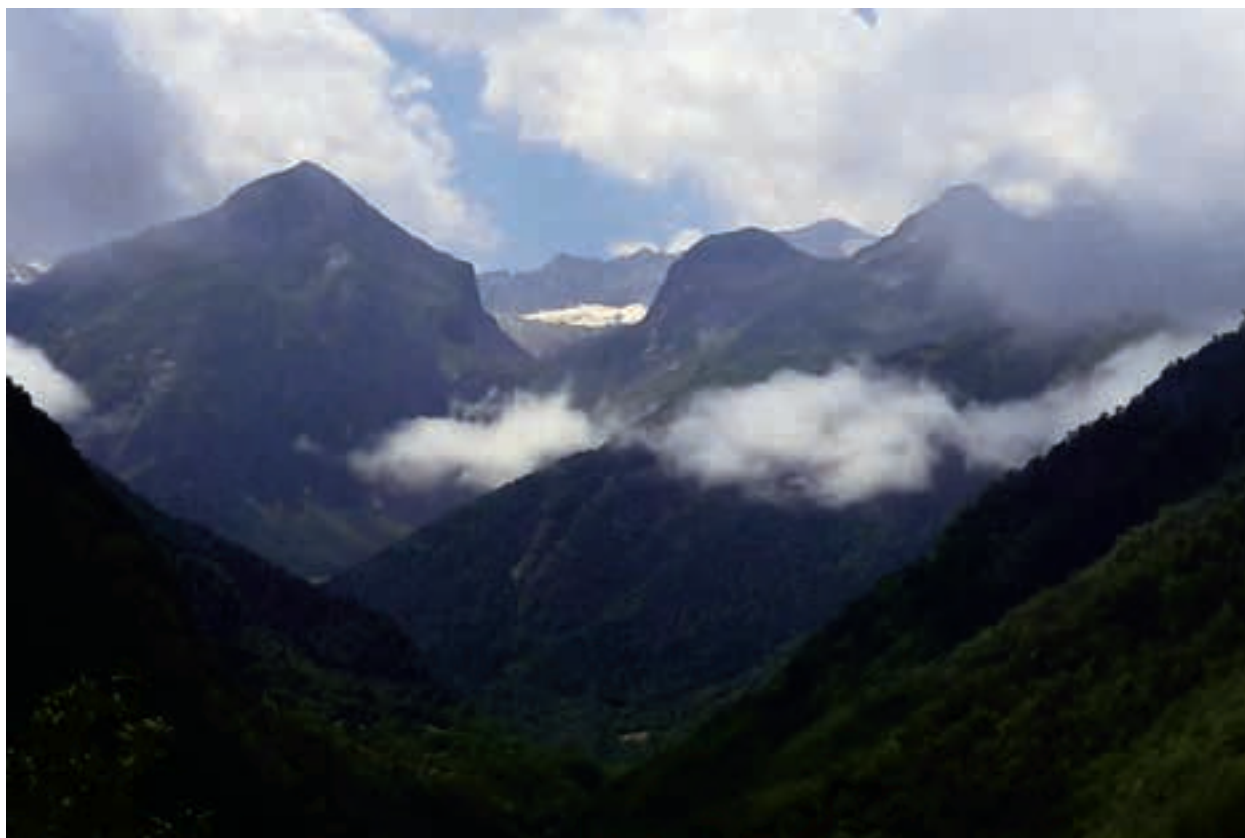
Paisatge que veiem tot baixant de l'Artiga de Lin.

En aquesta població, el 1858, Bernadette Soubirous, una noieta de 14 anys de família humil, va dir que havia tingut unes aparicions marianes en una gruta prop del riu, el gave de Pau. Gave és el nom comú que reben els rius d'aquesta zona dels Pirineus. A partir de les aparicions i de la consideració de miraculosa de l'aigua que va sorgir prop de la gruta, Lourdes va començar a rebre pelegrins de tot el món, fet que va fer necessari construir espais de culte i d'atenció als pelegrins, com ara allotjaments adequats a les necessitats dels malalts i impedits.