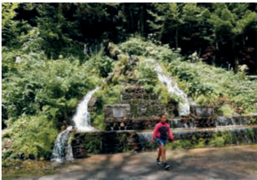
La font d'Eth Gresilhon.

Seguint el curs del riu Nere, anem una mica més amunt del Museu fins a la Fàbrica dera Lan, o Fàbrica de la Llana, on ens expliquen el procés d'elaboració de la llana, una activitat que havia estat molt important a la Vall. S'hi conserven les màquines que, aprofitant l'aigua del riu funcionaven en aquesta petita fàbrica fins a mitjans dels anys 70 del segle XX, quan l'economia de l'Aran va anar abandonant les activitats tradicionals de ramaderia i d'explotació dels boscos per dedicar-se a les activitats de serveis, relacionades sobretot amb l'esquí a les pistes de Vaquèira-Beret. L'afluència d'esquiadors va comportar la construcció d'hotels, xalets i apartaments, i l'obertura de tota mena d'establiments relacionats amb l'esquí i amb el turisme, no tan sols el d'hivern. També a l'estiu la Vall