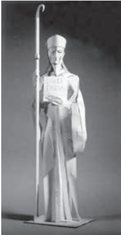
Abat Oliba – Pau i Treva (maqueta). Plaça del bisbe Oliba - Vic.