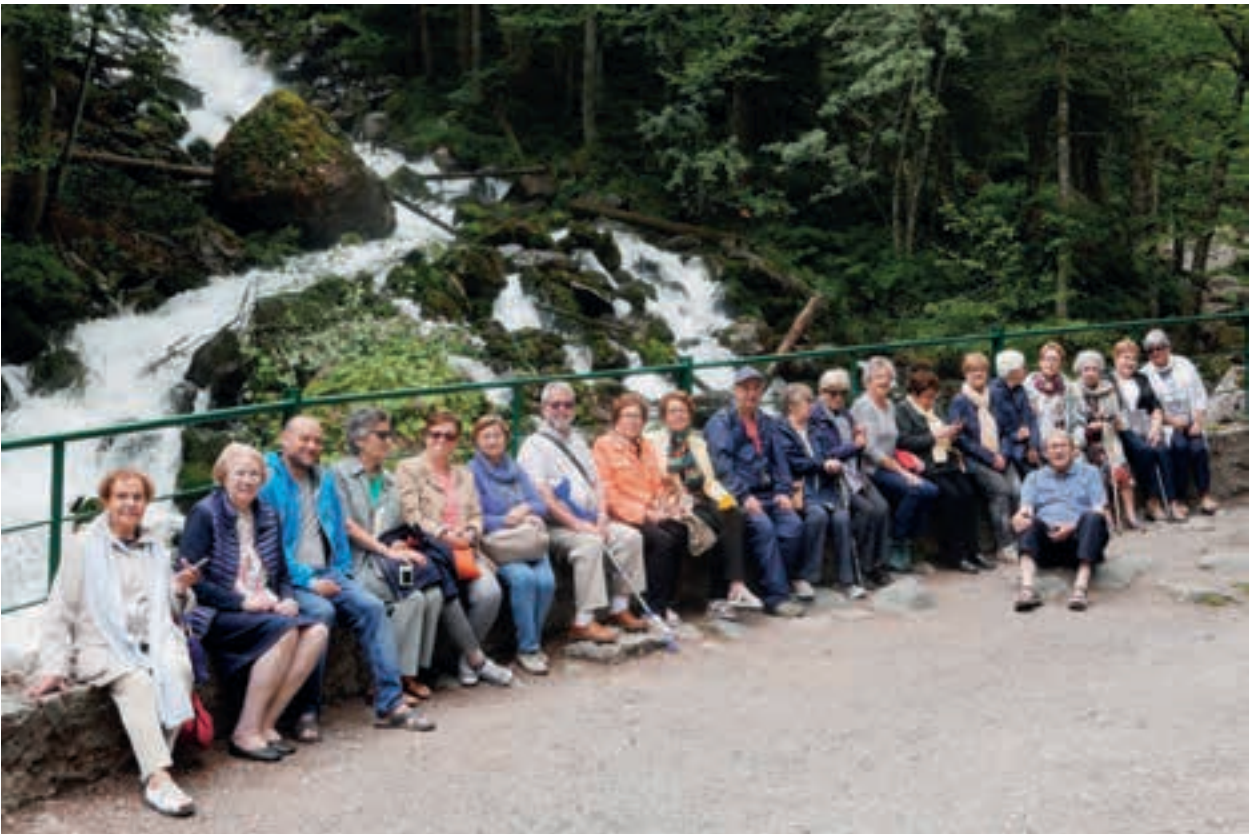
Descansant als Uells del Jueu.

Jueu) on ens retrobarem amb tots els qui hi anem amb l'autocar, indret espectacular amb salts d'aigua i una petita ermita. Molt a prop ens aturem també a la font