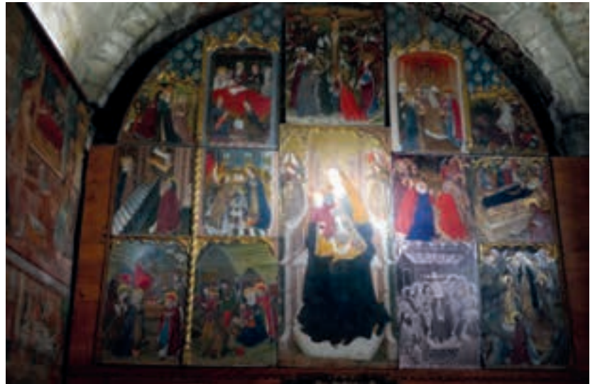
Retaule gòtic a l'església d'Arties.

ser el més conegut dels campanars romànics de Catalunya. L'església, com la de Santa Maria, és de tres naus, i també estava decorada amb frescos que actualment són al MNAC. La figura central és el Pantocràtor, acompanyat d'uns àngels que porten els símbols dels evangelistes, més avall veiem Maria i alguns apòstols, i en el nivell inferior decoració vegetal i geomètrica. Durant molts anys, quan els frescos originals ja eren al Museu, es van decorar les parets nues amb reproduccions, però últimament en aquesta església es pot veure una recreació dels frescos presentats amb la tècnica del video mapping ,