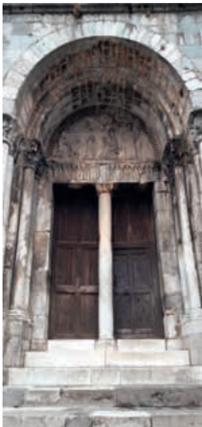
Sant Bertran de Comenge; portalada de la catedral.