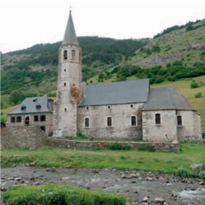
Santuari de la Mare de Déu de Montgarri.