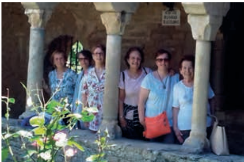
Les sis Roses del grup al claustre de Roda d'Isàvena.

Continuem cap a Roda d'Isàvena, un poblet molt petit, tres o quatre carrers i una plaça, dalt d'un turó prop del riu, que entre els segles X i XII va ser la seu del bisbat de Roda. Visitem la catedral (avui, parròquia), acompanyats d'una guia que ens fa notar les característiques d'una arquitectura romànica gens diferent de la que trobem a tot el Pirineu, però que presenta un tret força singular: els tres nivells de la capçalera. Una mica per sota del nivell de la nau central hi ha una gran cripta, oberta a la nau; i sobre la cripta, el presbiteri al qual s'accedeix per unes escales des de les naus laterals. Es tracta d'una estructura molt poc freqüent, similar a la de l'església de San Miniato al Monte, a Florència. El claustre de Roda també és romànic, i només la façana principal i el campanar són molt posteriors, del segle XVIII.