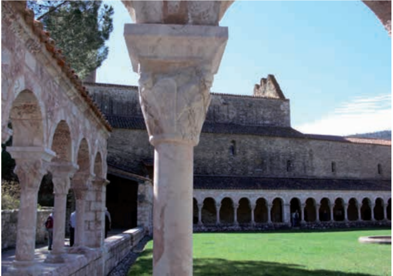
“La Regla de sant Benet ha servit per guiar i orientar la vida dels monestirs benedictins fins a l’actualitat, en diverses èpoques històriques i culturals i en les situacions geogràfiques més diverses”. (Foto: Sant Miquel de Cuixà).

nòmic; la projecció exterior. En primer lloc, convé destacar la gran importància que la Regla dona a la comunitat ja que, en la lectura dels diversos capítols, veiem que la comunitat (i aquí també podem parlar de família, d’empresa o comunitat política) és quelcom més que la suma dels seus membres. Però a la vegada la comunitat tampoc no és una justificació que permeti passar per sobre dels individus que la formen.