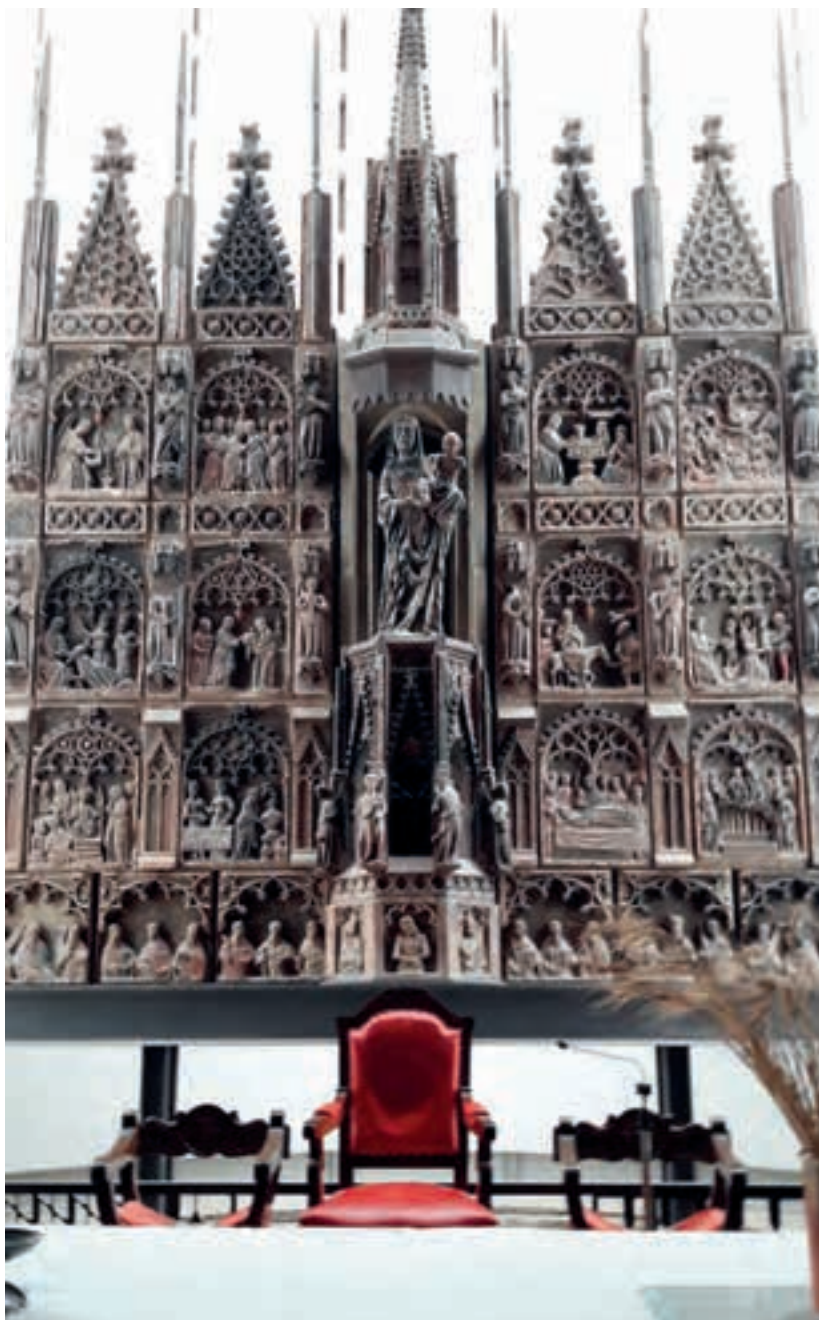
Retaule de pedra, gòtic, a l'interior de l'església parroquial.

Continuem el viatge, amb una brevíssima parada al Pont de Montanyana, on molts ni tan sols abandonen l'autocar, i després de passar pel túnel de Viella arribem a la capital de la Vall d'Aran, l'única