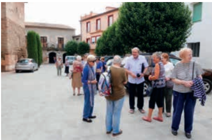
Castelló de Farfanya; passejant pel poble.