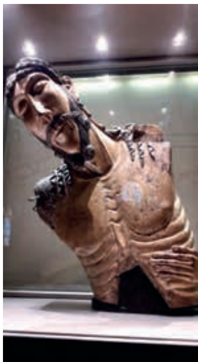
El Crist de Mijaran. Viella.

d'Aran rep molts visitants que busquen un clima fresc i una geografia que permet excursions de diferents nivells de dificultat.