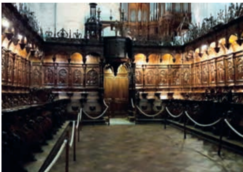
Sant Bertran de Comenge; cor de la catedral.