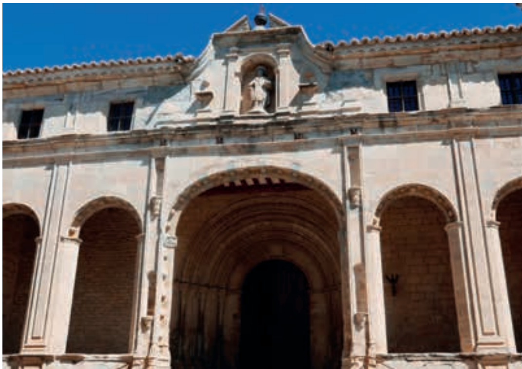
Façana de la catedral de Roda d'Isàvena.