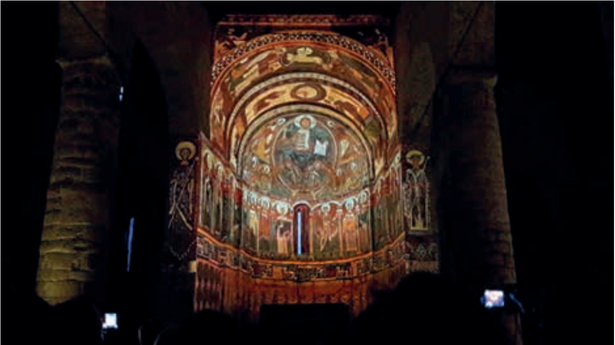
Recreació espectacular, a Sant Climent de Taüll, dels frescos originals.

satge és magnífic. En arribar a l'Artiga de Lin tenim prou temps per fer una bona passejada tot seguint una pista entremig del bosc fins arribar al riu Joèu. En