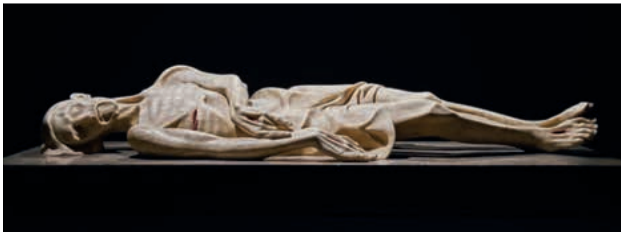
Crist jacent. Catedral de Girona.

L'art per a la litúrgia no sols és lícit, sinó que és convenient. Més encara, d'una manera o altra, és antropològicament necessari per a la dinàmica sacramental de la litúrgia i, més en general, per a la dinàmica sacramental de la vida cristiana. Perquè l'art i la litúrgia es troben per facilitar la comprensió sensible de la presència sacramental de Jesucrist en els sagraments, en tota celebració, i també en l'oració privada dins d'una església. D'aquesta manera l'art afavoreix, a través del missatge espiritual del qual és portador, la comunió amb el misteri de Déu, amb la pasqua de