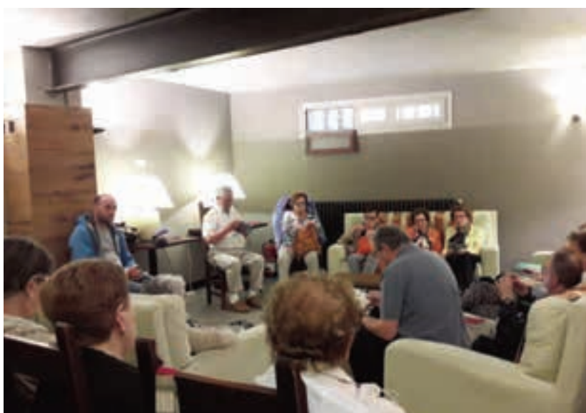
Fent la pregària en una sala de l'hotel.