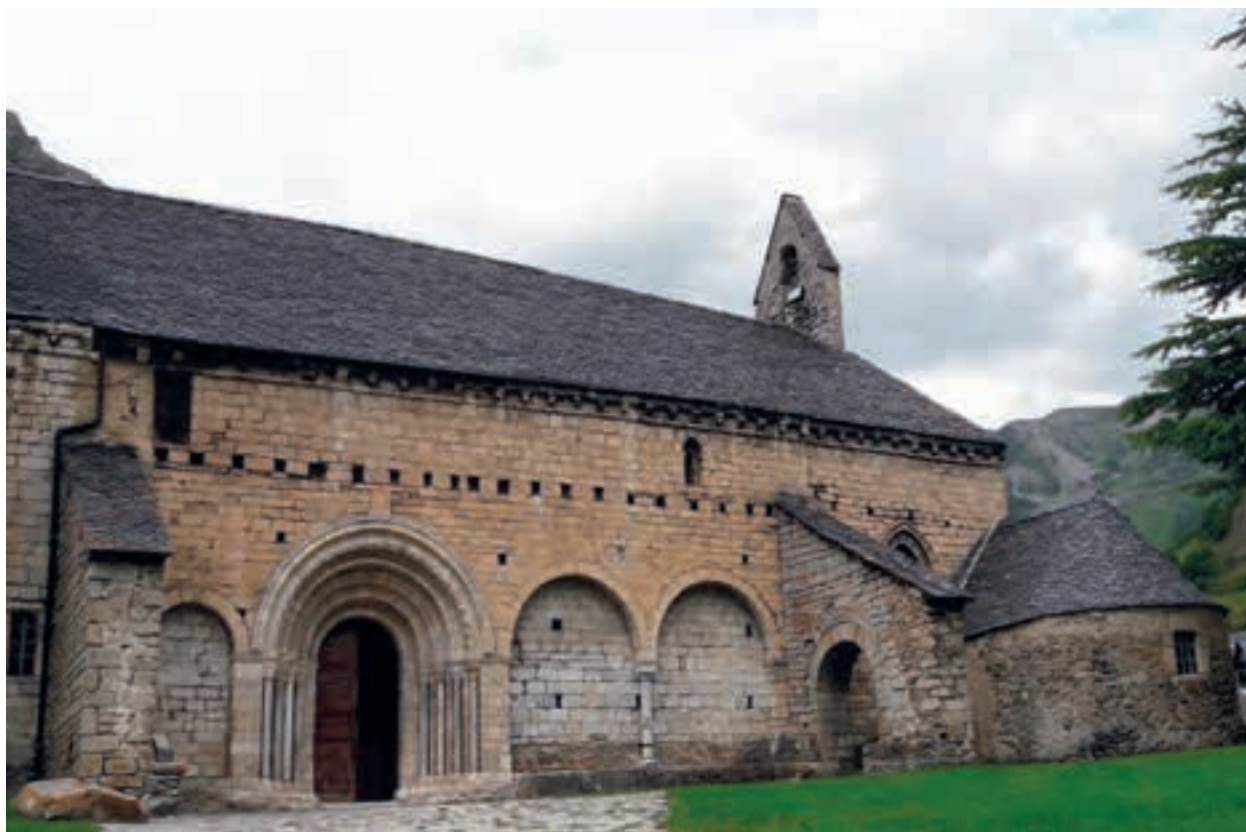
Parròquia de Salardú.

El poble és en un lloc elevat, i a la part més alta hi ha l'antiga catedral, en què podem veure l'evolució de la construcció al llarg dels segles. De l'època romànica destaca la façana de ponent, centrada per un únic campanar, que havia servit de torre de defensa. A la part baixa de la torre, la porta d'entrada a la catedral ens mostra un timpà romànic amb l'escena de l'Adoració dels Reis. L'interior és majoritàriament gòtic, d'una sola nau sense creuer i amb volta de creueria. Al mig de la nau hi ha el cor, renaixentista, amb un