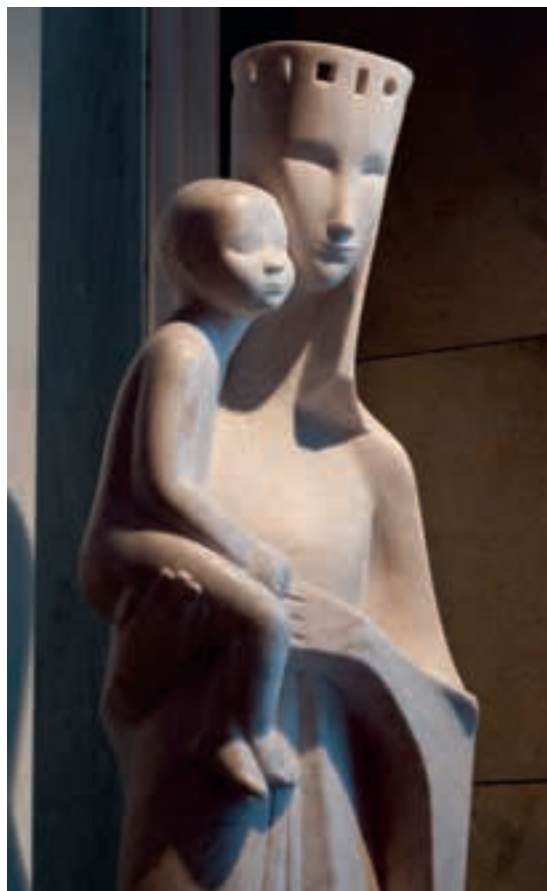
Maredeu. Capella Vedruna de Caldes de Malavella.

Tal com deia el Papa Benet XVI a la consagració de la basílica de la Sagrada Família de Barcelona, l'o-