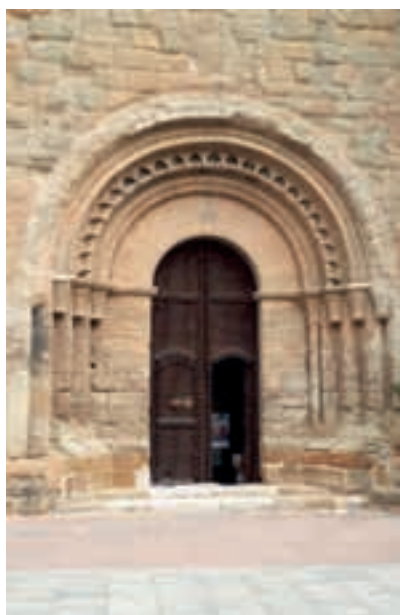
Castelló de Farfanya; porta de la parròquia.

I ja a l'autovia resem Laudes mentre ens anem acostant al massís de Montserrat, que resseguim per la banda sud a molt poca distància. No triguem gaire a ser a la Panadella, on hem previst una parada per esmorzar i on se'ns afe-