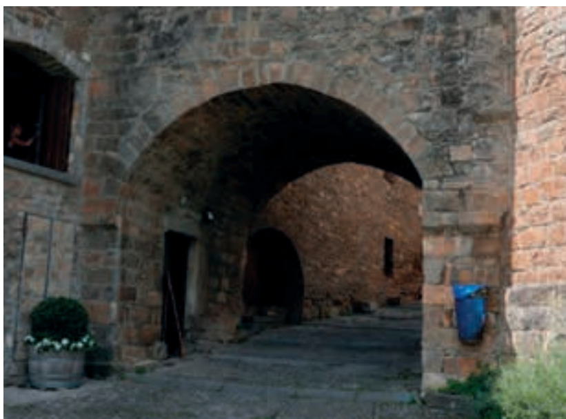
Aínsa. Plaça i detall del poble.

costat de la carretera, és molt plaer i conté tota mena d'indicacions escrites, visuals, tàctils, sonores... Les indicacions escrites o dibuixades estan també en alfabet Braille o en relleu. I en determinats punts es demana mantenir el silenci perquè molt possiblement es podrà sentir el cant d'algun ocell. El sender té poc més de mig quilòmetre i arriba fins a un lloc amb una vista espectacular, el Mirador de l'Isàvena, que passa engorjat al fons. Una taula d'orientació ens permet identificar les muntanyes que es veuen des d'allà.