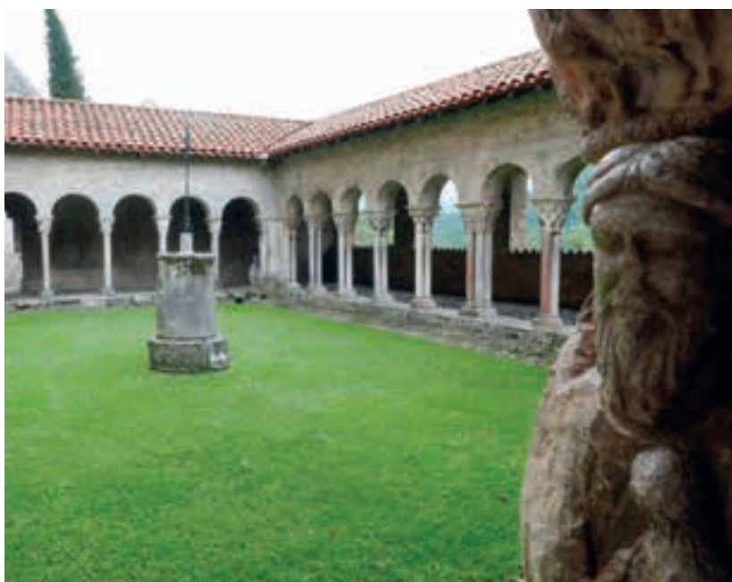
Claustre de la catedral de Sant Bertran de Comenge.

Dinem al nostre hotel i després d'una bona estona de descans ens trobem amb el guia per anar a fer