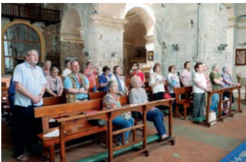
Església parroquial; interior.