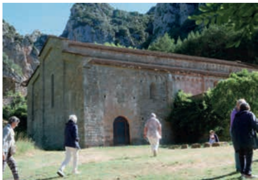
Antic monestir de Santa Maria d'Ovarra.

Per arribar-hi des de l'aparcament s'han de recórrer a peu uns 500 metres per un camí planer i travessar l'Isàvena per un pont dels anys 70 que substitueix el pont