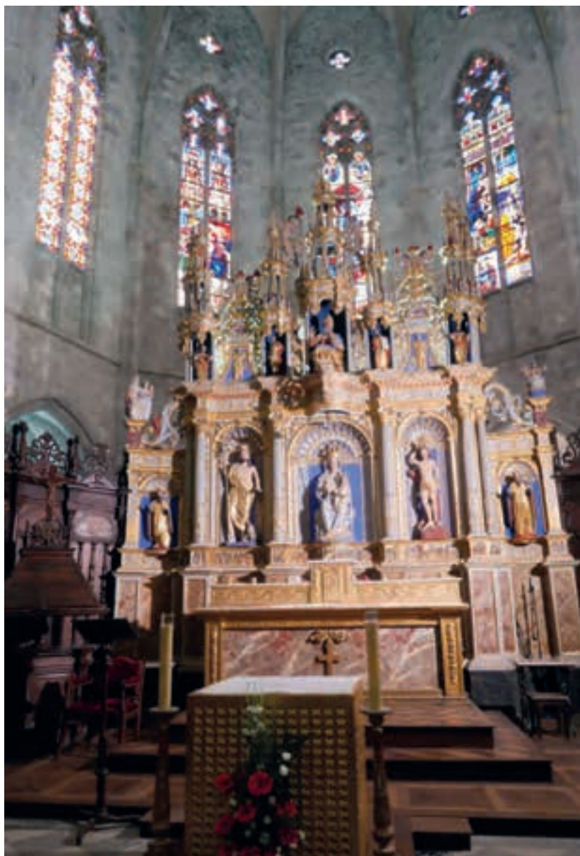
Sant Bertran de Comenge; retaule de la catedral.

cinc pisos. El sostre del presbiteri i del començament de la nau central està decorat amb unes pintures murals del segle XVI que representen el Judici Final amb gran expressivisme i emotivitat. També és molt interessant el retaule gòtic amb escenes de la vida de la Mare de Déu.