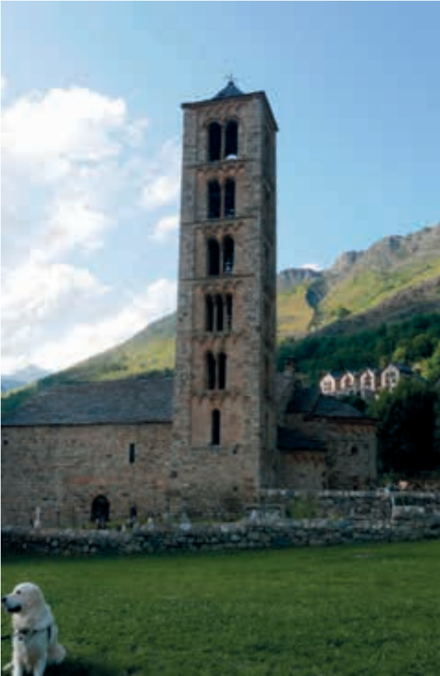
Sant Climent de Taüll.

una cripta de tres naus separades per columnes, i un claustre de planta irregular. La torre campanar, de planta quadrada, és de les més altes de la zona i tenia també la missió de defensa.