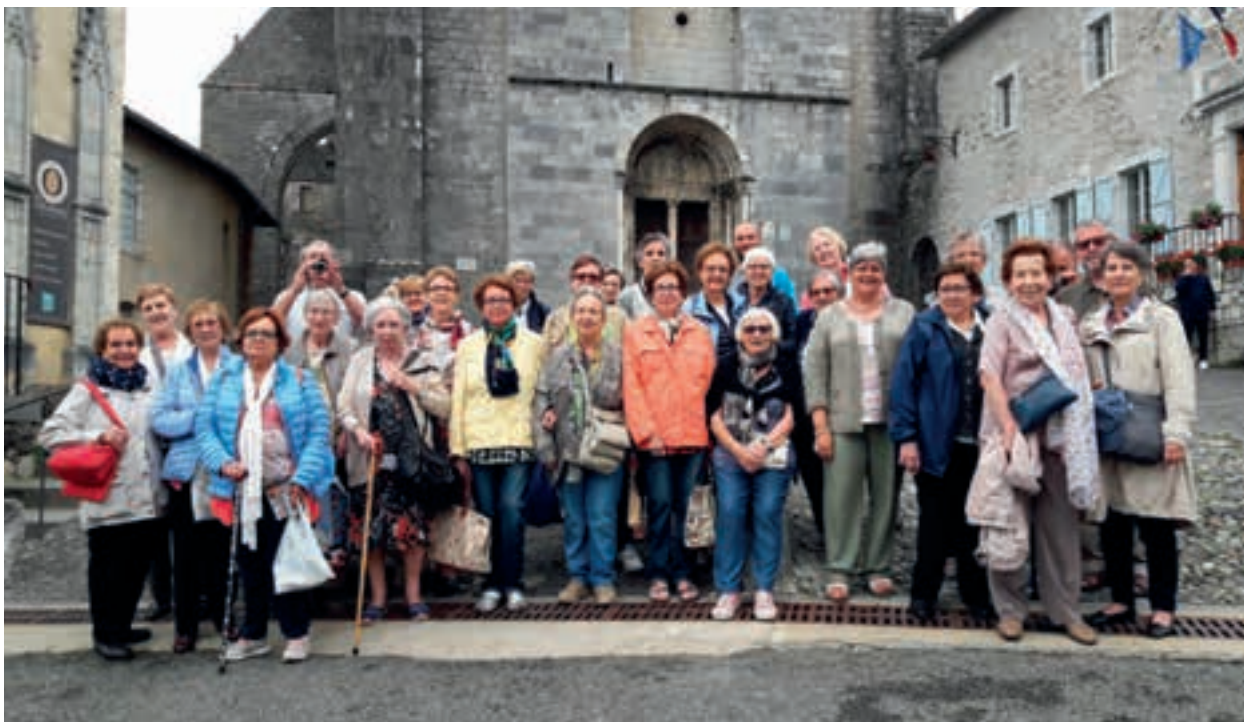
Tot el grup a Sant Bertran de Comenge.

lona, però li convé poder ser avui mateix al Miracle. La resta continuem cap a Barcelona, i hi arribem abans de les 8, una mica cansats de força hores d'autocar, però contents i agraïts pels dies que hem viscut tots junts.